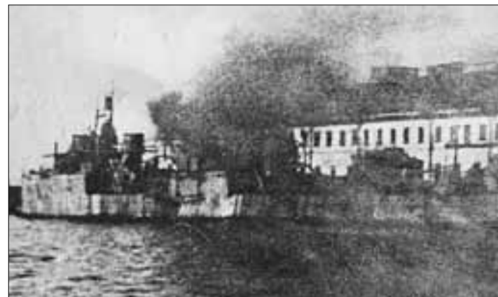
■ Эсминец «Карл Либкнехт» на испытаниях рядом с заводом