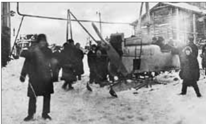
■ Аэросани, выпущенные «Красной Кузницей»