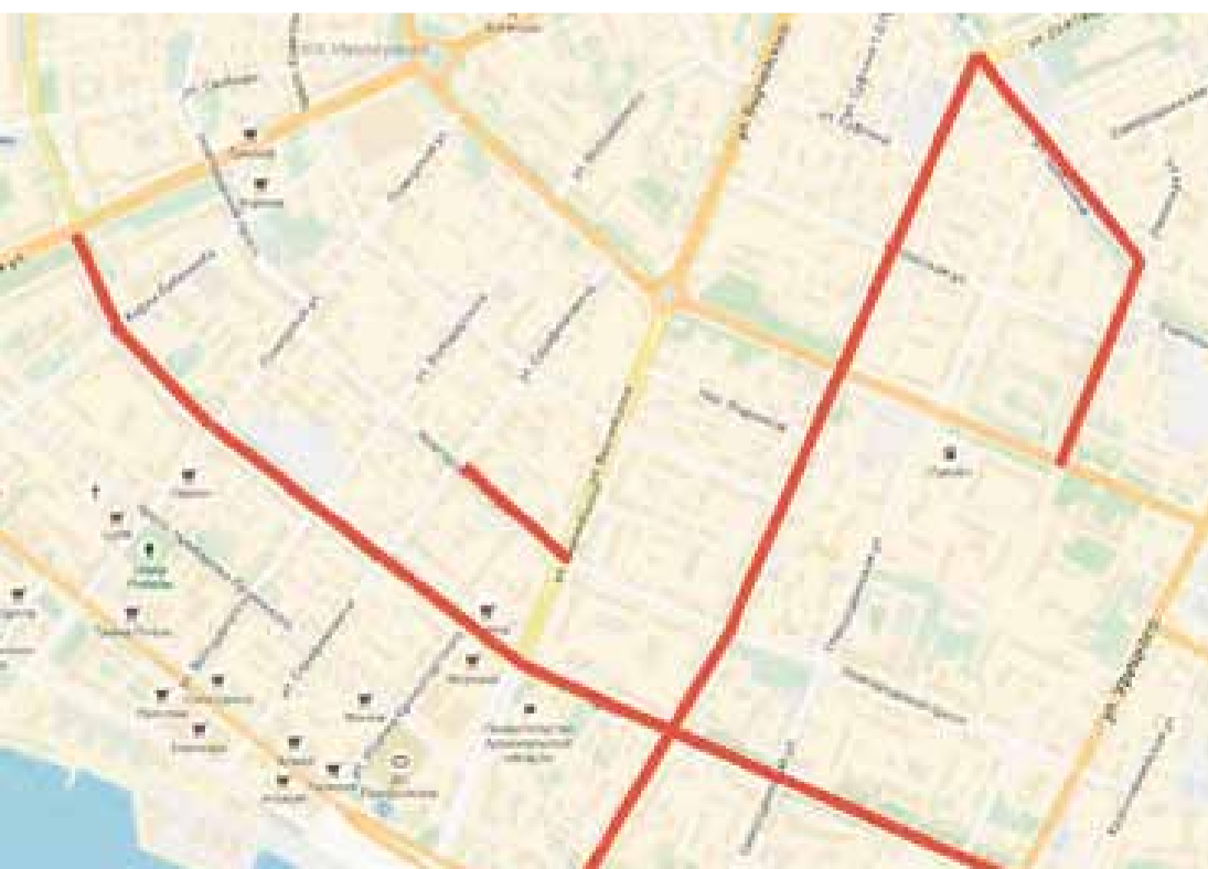
Схема ремонта ул. Терехина от ул. Советской до ул. Адмирала Кузнецова

Схема ремонта пр. Новгородского от ул. Выучейского до ул. Серафимовича; пр. Ломоносова от ул. Воскресенской до ул. Урицкого; ул. Розы Люксембург от наб. Северной Двины до ул. Шабалина; ул. Шабалина от пр. Обводный канал до ул. Розы Люксембург