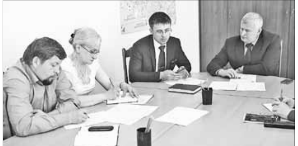
■ На заседании общественного совета обсуждаются важные окружные вопросы.