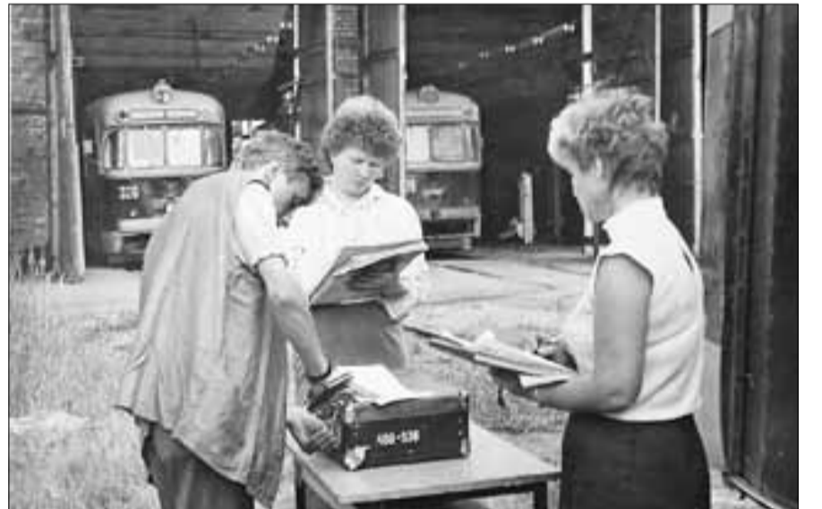
■ Конкурс профессионального мастерства водителей трамвая; одно из заданий – приемка вагона.