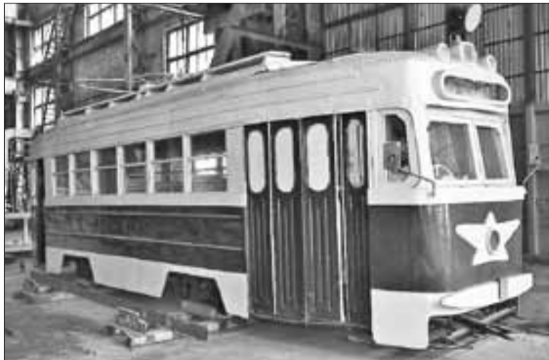
■ В процессе реставрации уцелевший трамвай воссоздали в мельчайших деталях.

Чтобы добраться с южных окраин города в его северную часть, пассажирам можно было доехать от завода «Красный Октябрь» до улицы Выгучейского на трамвае «южного» маршрута № 2, где пересечь на трамвай № 1, который курсировал от конечной остановки на улице Урицкого до конечной в Соломбале у завода «Красная Кузница». Уже оттуда можно было доехать до порта Экономия или до ми-