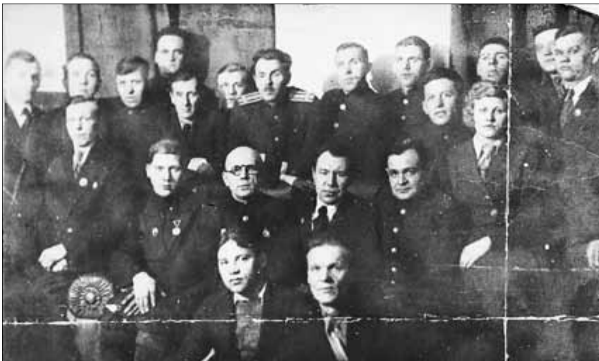
■ Руководство завода и лучшие стахановцы военных лет 1943-45 годов