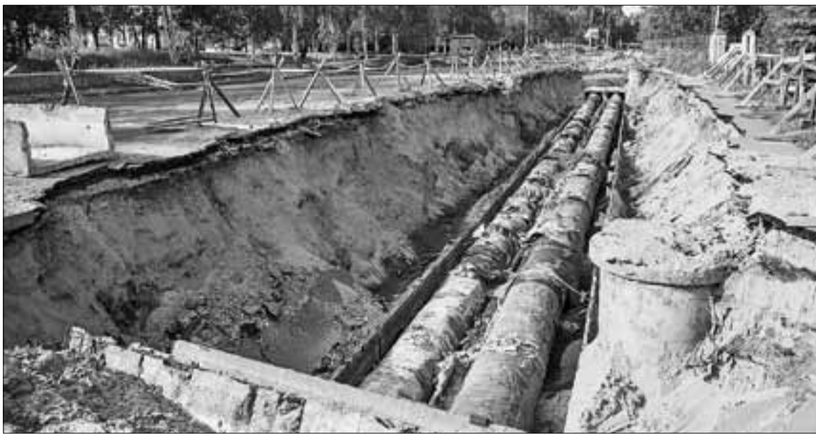
■ На проспекте Обводный канал запланирован ремонт теплотрассы.

– Восемь бригад, этого вполне достаточно. С техникой также проблем нет. Что касается сроков про-