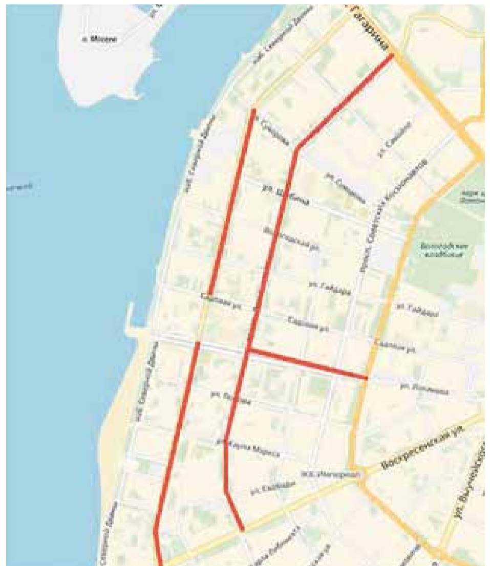
Схема ремонта пр. Новгородского от ул. Выучейского до ул. Серафимовича; пр. Ломоносова от ул. Воскресенской до ул. Урицкого; ул. Розы Люксембург от наб. Северной Двины до ул. Шабалина; ул. Шабалина от пр. Обводный канал до ул. Розы Люксембург

Схема ремонта пр. Ломоносова от ул. Гагарина до ул. Воскресенской; пр. Троицкий от ул. Воскресенской до ул. Логинова; пр. Троицкий от ул. Садовой до ул. Гагарина (исключая пересечения с ул. Гайдара и ул. Вологодской); ул. Логинова от пр. Ломоносова до пр. Обводный канал