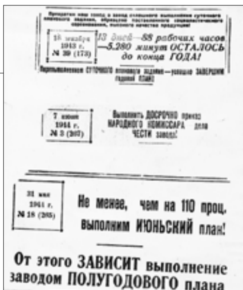
■ Такими агитационными плакатами подбадривали рабочих